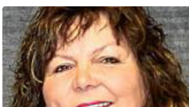
Martina Braun

Auf Anfrage hat die Landtagsabgeordnete von Bündnis 90/Die Grünen Martina Braun gegenüber dem SÜDKURIER unmissverständlich dargelegt, dass sie eine Klassifizierung als Landesstraße für ausgeschlossen hält. Selbst den Bau der Straße selbst schätzt sie als unrealistisch ein.