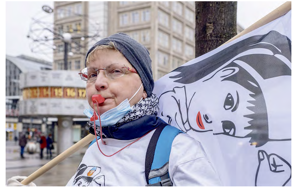
Entschlossen: Aktivistin von Pro Krankenhaus Havelberg

Das Fatale an dem Bezahlungsmodell ist die Verknüpfung der medizinischen Tä-