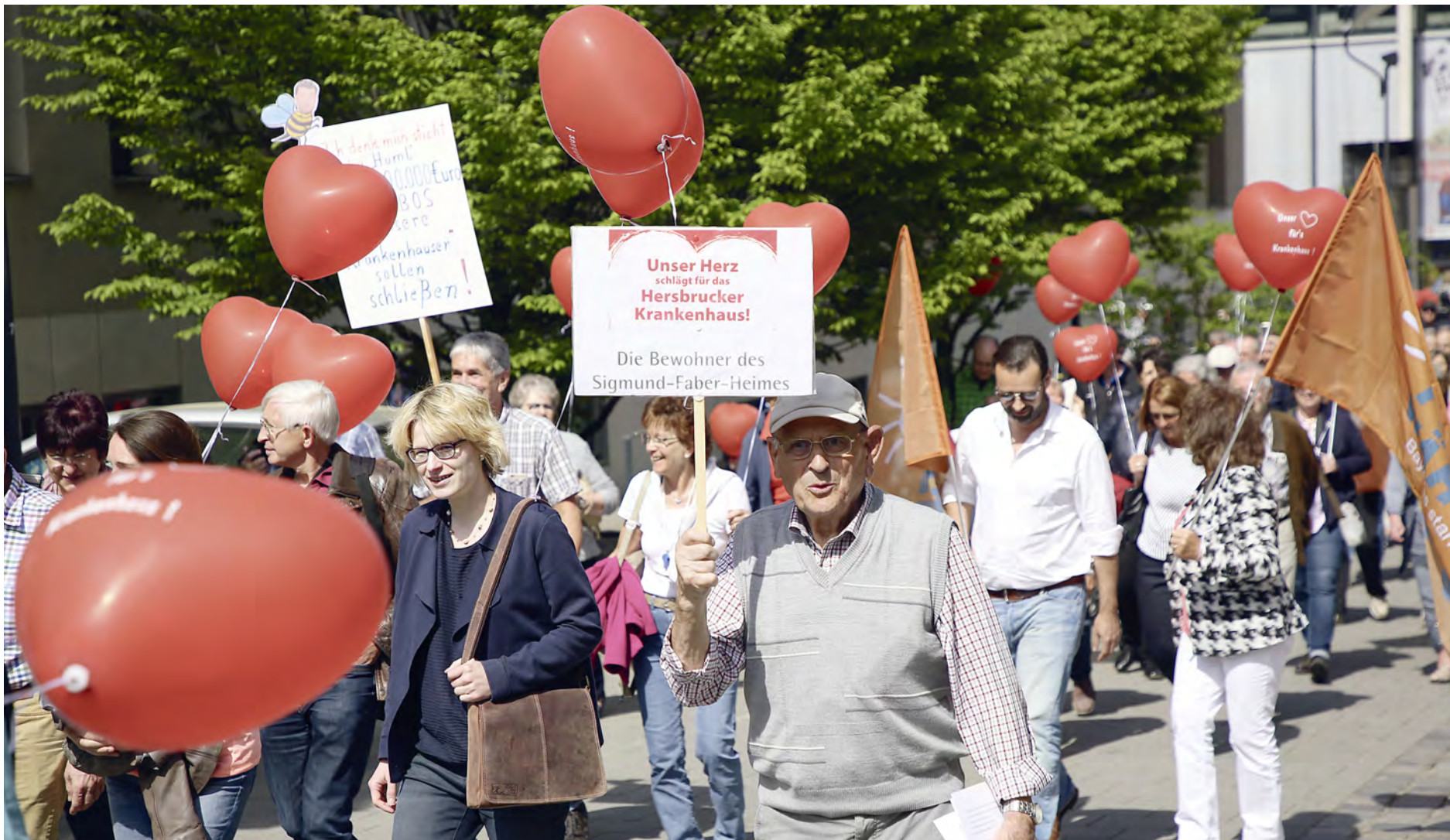
Bayerns BürgerInnen kämpfen seit Jahren für ihre Kliniken, hier mit einer Protestdemo 2018 in Nürnberg für den Erhalt des Hersbrucker Krankenhauses

Bundesgesundheitsminister Karl Lauterbach plant mit seiner Krankenhausreform einen radikalen Abbau wohnortnaher Krankenhäuser, vor allem in Flächenländern wie Bayern. Gegen die Pläne, die noch 2023 in ein Gesetz gegossen werden sollen, gibt es Widerstand. Auch Bayerns Gesundheitsminister Klaus Holetschek inszeniert sich als Reformgegner. Doch sein Einspruch wirkt wie ein Wahlkampfmanöver, denn den Worten folgen keine Taten.